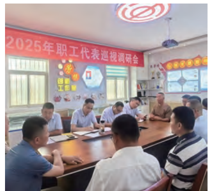
近日,灌西公司工会组织职工代表对基层单位进行民主巡视,深入生产现场等地进行巡视,通过听、问、看等方式对职工关心的生产经营、班组建设、民主管理等方面进行调查研究。(西工)

以民主管理为核心,搭建职工“连心桥梁”。工会坚持“以职工为中心”的工作导向,将民主管理作为凝聚职工共识、解决实际难题的关键抓手,通过多元化机制畅通沟通渠道,切实增强职工归属感与企业向心力。坚持“依靠职工、查、谈”等形式,开展“职工巡视”“对话沟通”“代表提案”等活动,畅通职工诉求渠道,与职工面对交流,搭建职工“连心桥”。及时解决职工关心的工作生活等实际问题,打造多元化“安康驿站”,积极开展“解民忧、纾民困、暖民心”行动,增强了职工的归属感和凝聚力。(房工)