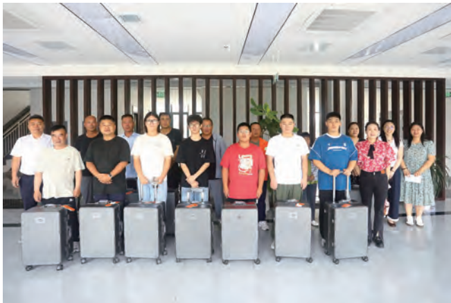
近日,台北(华茂)公司开展“助梦求学·情系职工”金秋助学活动。为即将迈入高中和大学校门的15名职工子女送上祝福与关怀,助力他们心怀热爱,奔赴山海,在新学年扬帆启航。(房金鹤)

聚焦前沿“储”动能,锚定未来赛道。着眼新能源产业发展趋势,公司将产改与长远人才储备结合,提出“全员学新业、蓄力新赛道”目标,推动产业工人成为企业布局新能源领域的“先行者”。在稳固传统业务基础上,公司积极构建以新能源为主体的新型电力系统:承接充电桩、光伏板安装等新能源工程,依托现有电网线路布局分布式光伏项目,在智能电网建设、源网荷储一体化、新型储能、太阳能光热产业等领域打造特色样板,助力实现绿色低碳、多能互补、高效协同发展,为企业抢占未来赛道储备核心动能。(宋云)